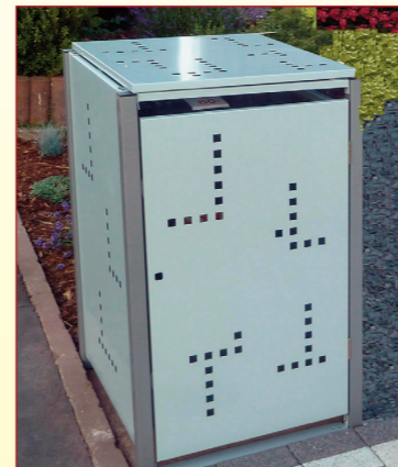
Beispiel mit Deckel und Tür.