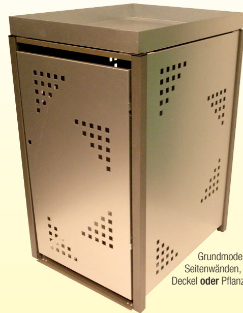
Grundmodell besteht aus Rahmen, Seitenwänden, Tür, Rückwand und Deckel oder Pflanzkasten