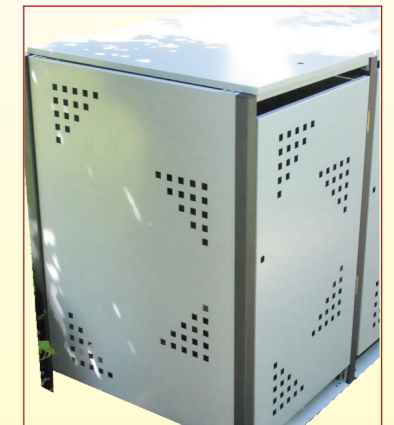
Beispiel mit Deckel und Tür.