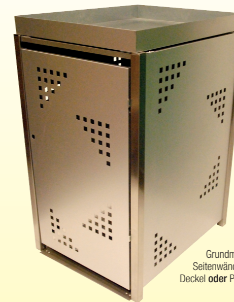
Grundmodell besteht aus Rahmen, Seitenwänden, Tür, Rückwand und Deckel oder Pflanzkasten